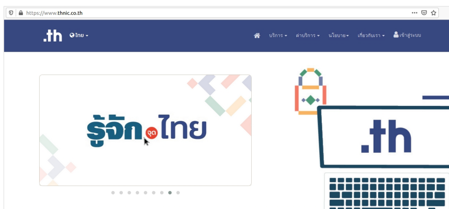
ภาพที่ 1 เว็บไซต์ทีเอชเน็ต