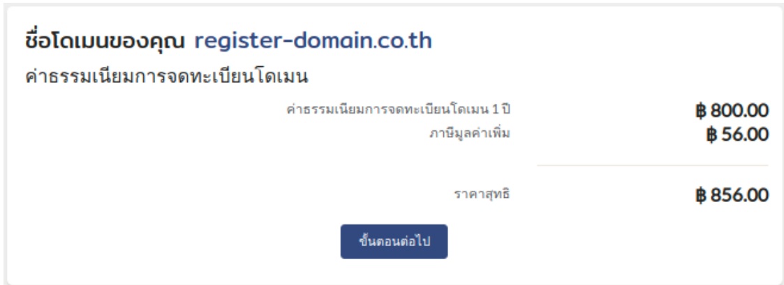
ภาพที่ 14 หน้าจอเข้าสู่ขั้นตอนต่อไป