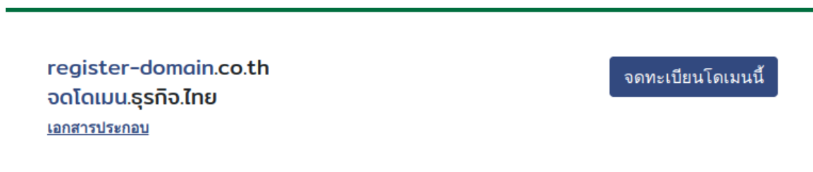
ภาพที่ 5 หน้าจอ แสดงผลการค้นหาและจดทะเบียนชื่อโดเมน

4.2. เลือก 'จดทะเบียนโดเมนนี้' เพื่อเข้าสู่ขั้นตอนการส่งคำขอจดทะเบียนชื่อโดเมน (ภาพที่ 5)