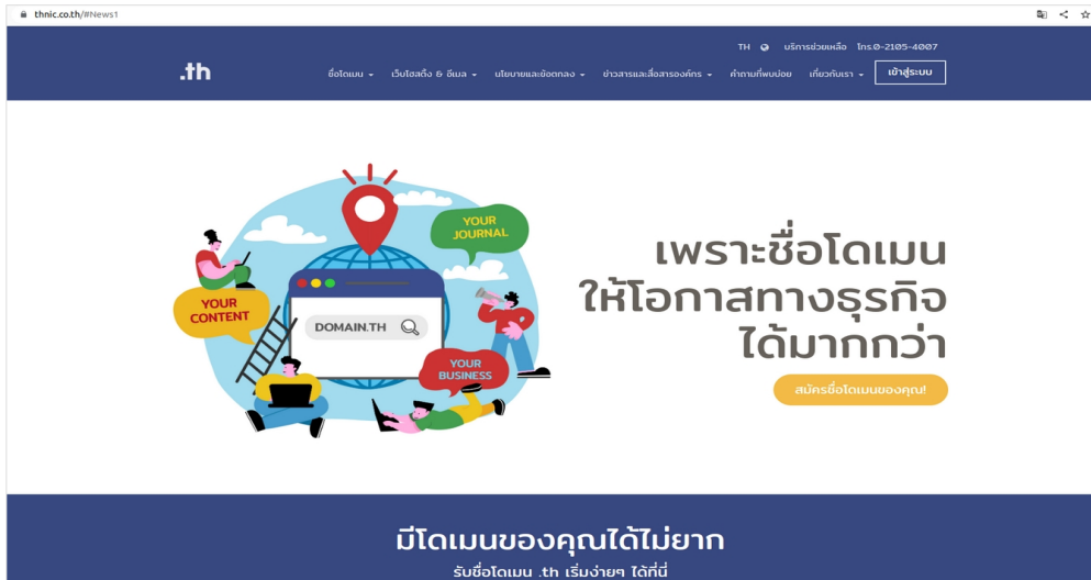
ภาพที่ 1 หน้าจอ เว็บไซต์ทีเอชเนค