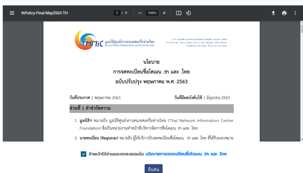
ภาพที่ 6 หน้าจอ ยอมรับเงื่อนไขและเข้าสู่ขั้นตอนส่งคำขอจดทะเบียนชื่อโดเมน